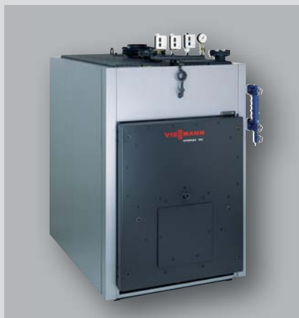
Vitoplex 100 – nízkotlaký parní kotel s provozním přetlakem do 1 bar, s výkonem 580 až 1 450 kW

Široké vodní stěny a velké vzdálenosti mezi spalinovými trubkami zabezpečují dobrou vlastní cirkulaci a bezpečný přenos tepla a tím i vysokou provozní bezpečnost a dlouhou životnost.