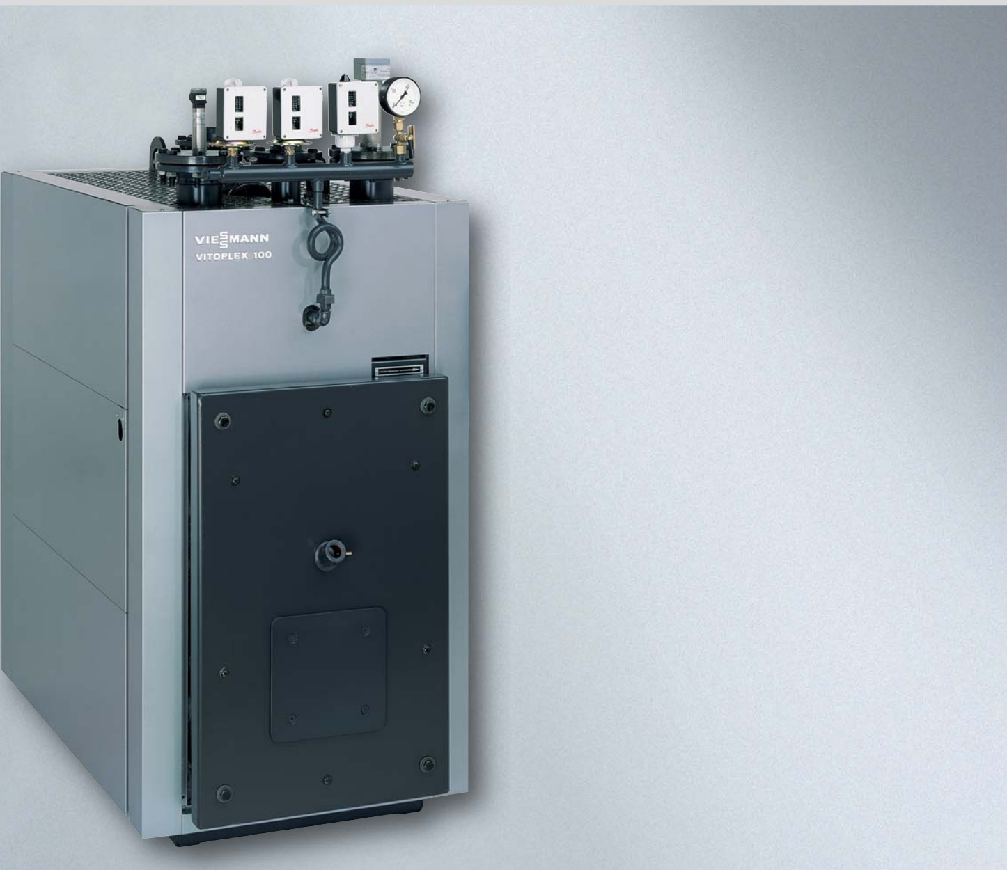
Vitoplex 100 – nízkotlaký parní kotel