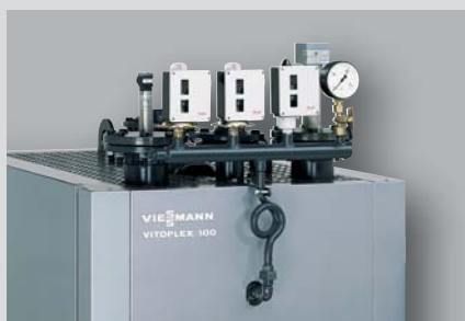
Bezpečnostní armatury kotle Vitoplex 100