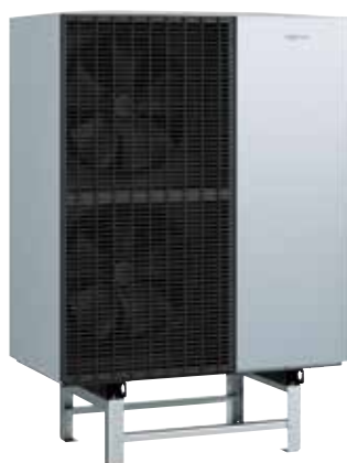
Venkovní jednotka Vitocal 151-A s podlahovou konzolí.