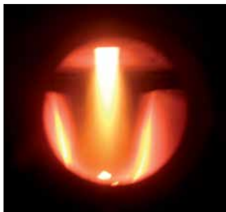
Zplyňovací technika u kotle Vitoligno 100-S.

Regulace Ecotronic 100 přesvědčí jednoduchou a intuitivní obsluhou. Na podsvíceném displeji se zobrazují všechny informace pomocí symbolů. Sloupcový graf informuje o aktuálním stavu nabití akumulárního zásobníku topné vody.