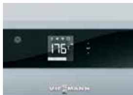
Regulace Ecotronic 100 s podsvíceným displejem pro jednoduchou a intuitivní obsluhu.

Vitoligno 100-S je kompaktní, cenově atraktivní zplyňovací kotel na kusové dřevo, který se hodí jak pro monovalentní, tak bivalentní provoz (doplnění plynového nebo olejového topného kotle).