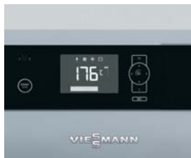
Regulace Ecotronic 100 s podsvíceným displejem pro jednoduchou a intuitivní obsluhu.

Vitoligno 150-S je kompaktní zplyňovací kotel na kusové dřevo za zajímavou cenu, který je vhodný jak pro monovalentní, tak bivalentní provoz (jako další zdroj tepla k plynovému kotli).