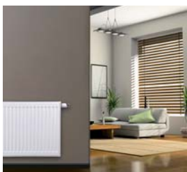
10letá záruka na topná tělesa Viessmann.