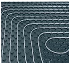
10letá záruka na podlahové vytápění Viessmann.