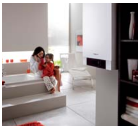
5letá záruka na kondenzační kotle a tepelná čerpadla do 35 kW ve spojení s komplexními službami Viessmann.