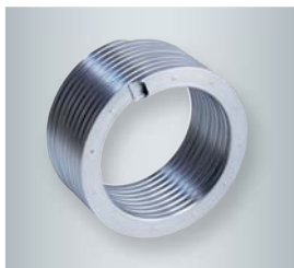
10letá záruka na výměníky tepla Inox-Radial.