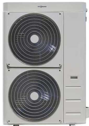
Vitocal 100-A 14 až 16 kW

Nová tepelná čerpadla vzduch/voda Vitocal 100-A pokrývají většinu požadavků u novostavby i při modernizaci. S výkony mezi 6 a 16 kW zaručují tato zařízení komfortní dodávky tepla a přípravu teplé vody.