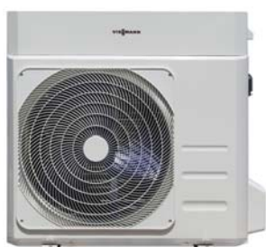
Vitocal 100-A 6 až 8 kW

Tepelné čerpadlo vzduch/voda: maximální účinnost při minimální spotřebě energie.