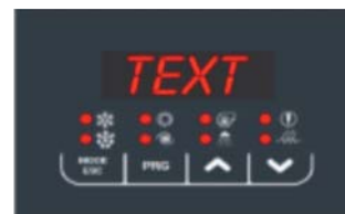
Snadná obsluha s displejem s kódy přímo na tepelném čerpadle.