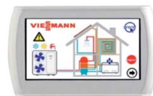
Dotykové dálkové ovládání s rozšířenými grafickými funkcemi.