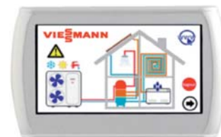
Dotykové dálkové ovládání s rozšířenými grafickými funkcemi.