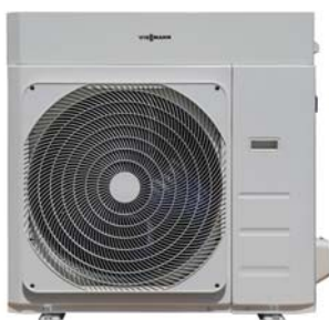
Vitocal 100-A 10 kW