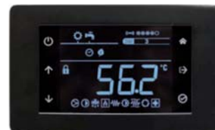
Komfortní dálkový ovladač s s ovládáním pomocí tlačítek.