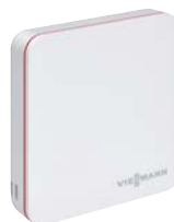
Termostat ViCare pro více komfortu a vyšší účinnost.