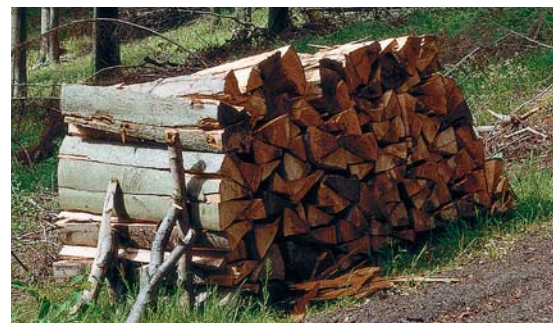
Heizen mit Holz – der natürlichste Brennstoff der Welt

Der Kessel passt sich stufenlos dem jeweiligen Wärmebedarf an. Mit einem Wirkungsgrad von bis zu 94,6 Prozent ist der Vitoligno 300-S der effizienteste Scheitholzkessel seiner Bauart. Mit der Lambdasonden-Regelung sowie dem Abgastempersensord wird eine effiziente und emissionsarme Verbrennung erzielt (Einhaltung 1. BImSchV, 2. Stufe). Mittels integriertem, intelligentem Puffermanagement lassen sich bis zu neun Prozent der Brennstoffkosten einsparen.