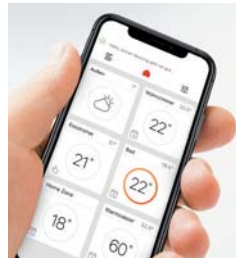
Komfortable Bedienung über Viessmann App per Smartphone

Die Fernbedienung Vitotrol 350-C mit Touch-Display wurde vom Design Zentrum Nordrhein-Westfalen mit dem Red Dot Design Award 2014 ausgezeichnet.